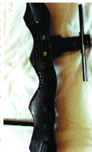
Note that the grip of the Seneca bow is convertible so that it can be used right or left handed.

El arco viene con una cuerda de dacrón y unos cables de acero forrados de plástico. El cuerpo del arco es convertible a diestro o zurdo en unos pocos minutos y con el único instrumento requerido, el destornillador de estrella y unas llaves allen. Sólo hay que cambiar una pequeña parte del cuerpo y situarla en otro encaje, ¡ y ya está !, un arco zurdo. El arco viene también acompañado con un par de flechas de fibra de vidrio, un reposaflechas, un protector de brazo, un separador de cables, una dactilera de diestros e incluso con unas pegatinas de camuflaje para hacer el arco más "bonito" que el negro clásico de las palas y del cuerpo. La cuerda también tiene dos nocks de plástico-goma para localizar la posición de la flecha en la cuerda. Dependiendo si usa el arco como diestro o zurdo, la posición del nocking point cambia. El reposaflechas está preparado para servir de diestro o zurdo. Sólo debe cortar la parte que no se use en uno u otro caso y ya está. Y ahora un consejo. Yo lo