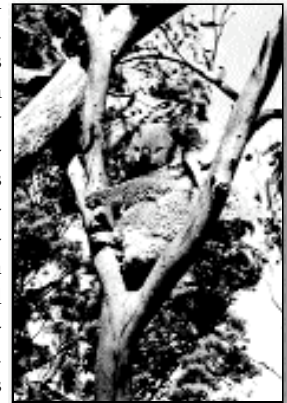
Aparentemente este es un "tree stand." típico Australiano Editorial

Al vivir en un país tan alejado del mercado mayoritario del tiro con arco, como lo es Australia, encontrar tiendas de arqueología y además bien abastecidas es una tarea casi imposible. No tenemos tiendas en cada ciudad o pueblo, como sucede en USA. Todo nuestro material lo tenemos que adquirir por catálogo sin poder verlo ni probarlo. Tal y como sucedió al comprar mi propio arco, tuve que escuchar los consejos y aplicar las experiencias de otros arqueros que conocía. Pero para niños, esto no era fácil. Por ello tuve que utilizar el mejor "juguete" que tenemos disponible hoy en día, "Internet". ¡Hi ho, hi ho, surfeando por las páginas web de tiro con arco de nuevo, qué divertido!. Sólo que esta vez para ayudar a mi hijo de 4 años.